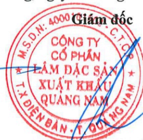
Quảng Thanh Bình