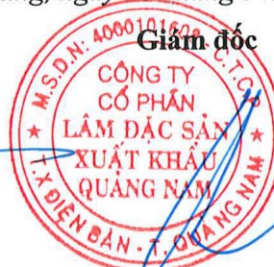
Quảng Thanh Bình